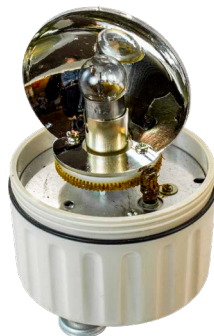
Рис. 1 – Отражатель